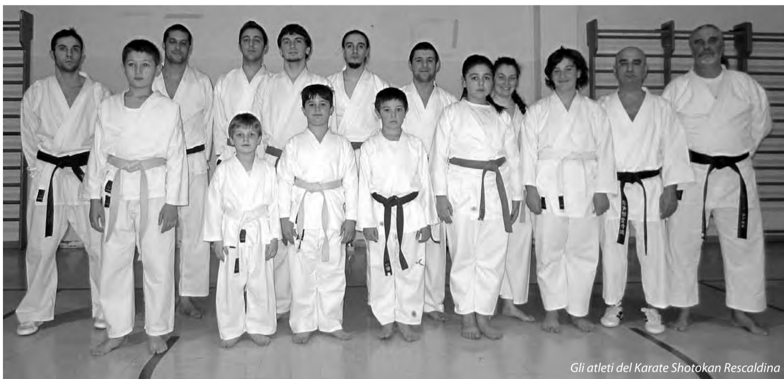
Gli atleti del Karate Shotokan Rescaldina