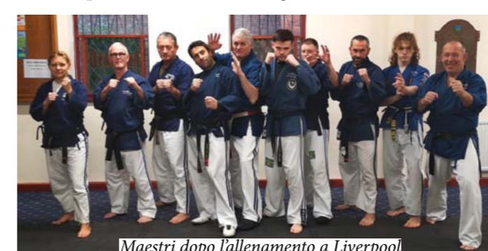
Maestri dopo l'allenamento a Liverpool