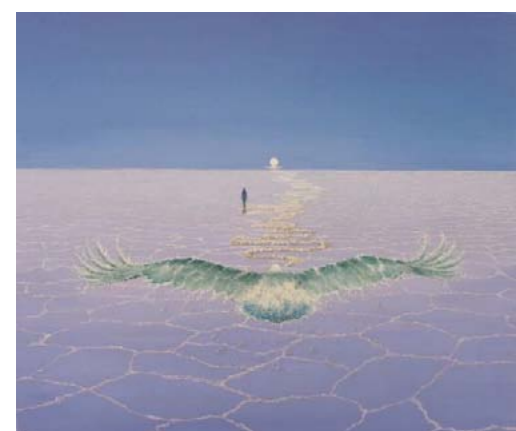
3° Classificato (Visitatori): Fadin Daniela "All'orizzonte lo"