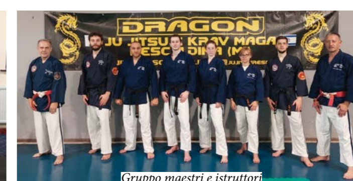
Gruppo maestri e istruttori