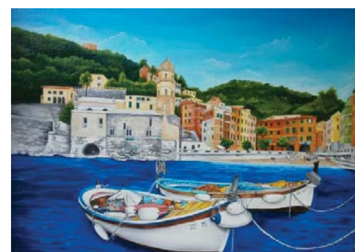
1° Classificato (Visitatori): Russo Antonietta "Vernazza"