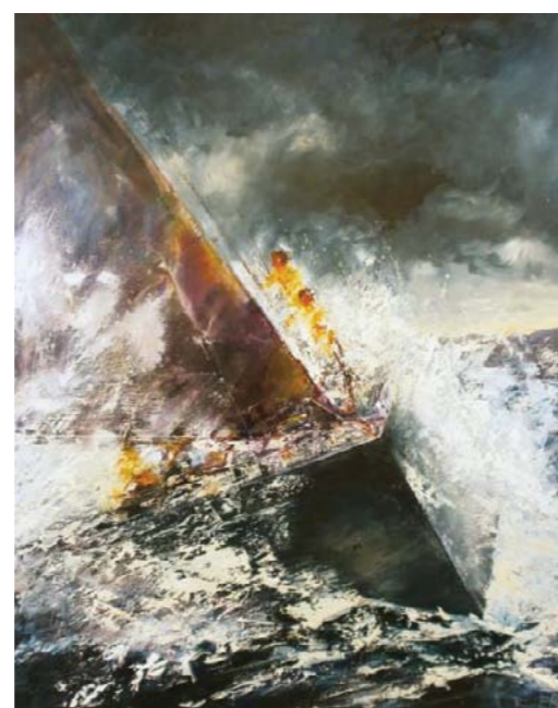
2° Classificato (Visitatori): Ariti Angelo "Ultimo miglio"