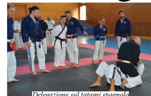
Delegazione sul tatami spagnolo

Siamo giunti alla fine del 2022: è stato un anno ricco di eventi che si sono svolti per onorare e festeggiare i 20 anni dell'associazione sportiva Dragon ju jitsu dojo. Percorriamo il calendario all'indietro: domenica 19 dicembre, a conclusione del 20° anno sportivo, tutti gli atleti di Rescaldina e Venegono Inferiore salirono insieme sul tatami, per partecipare ad un evento sportivo denominato Light's Emo-